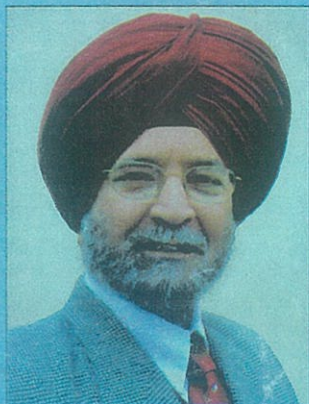
ਮਨਮੋਹਨ ਸਿੰਘ ਦਾਉਂ